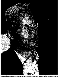
Carl Holst, formand for regionsrådet, Region Syddanmark