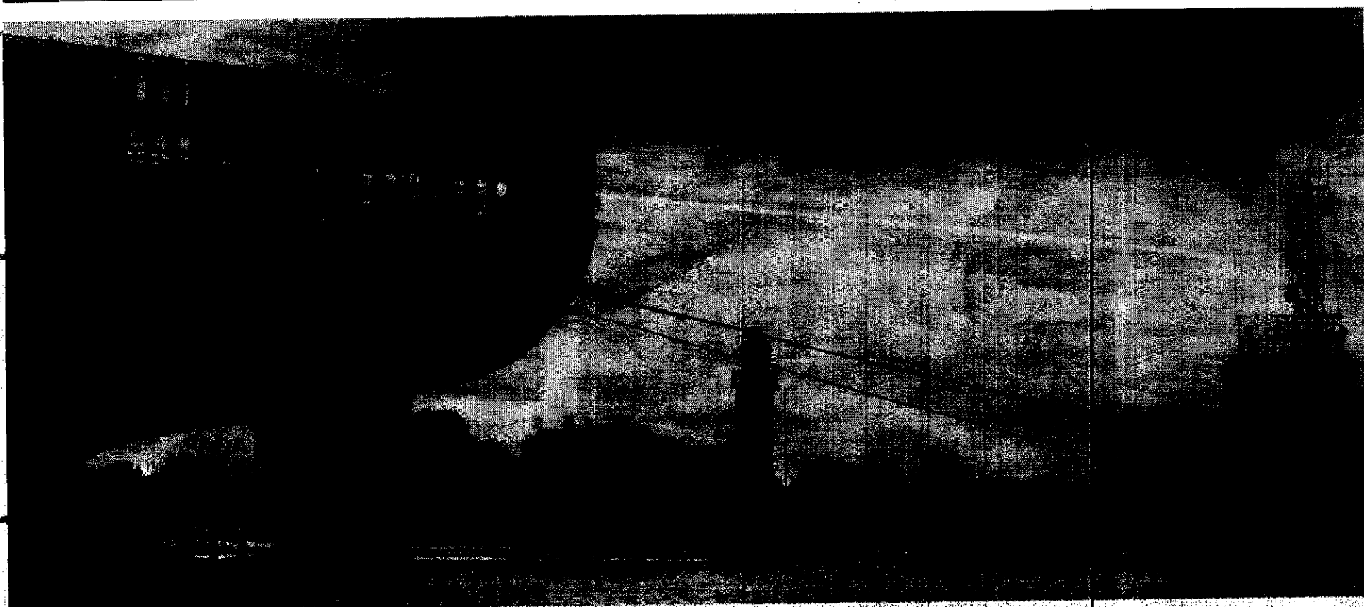
■ "Mathilde Mærsk", der er det sidste i en serie på verdens største containerskibe, bliver bugseret ud gennem fjorden og Gåbet.