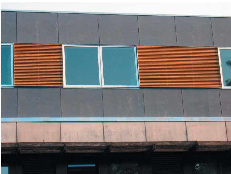
Patologisk afdeling, Næstved Sygehus 2005 6 mill. kr

En tilbygning beliggende på toppen af en eksisterende. Bygningen blev udført samtidig med at ventilation etc. til de eksisterende operationsstuer fungerede. En enkel krop er lagt ovenpå indeholdende kontorer til læger etc.