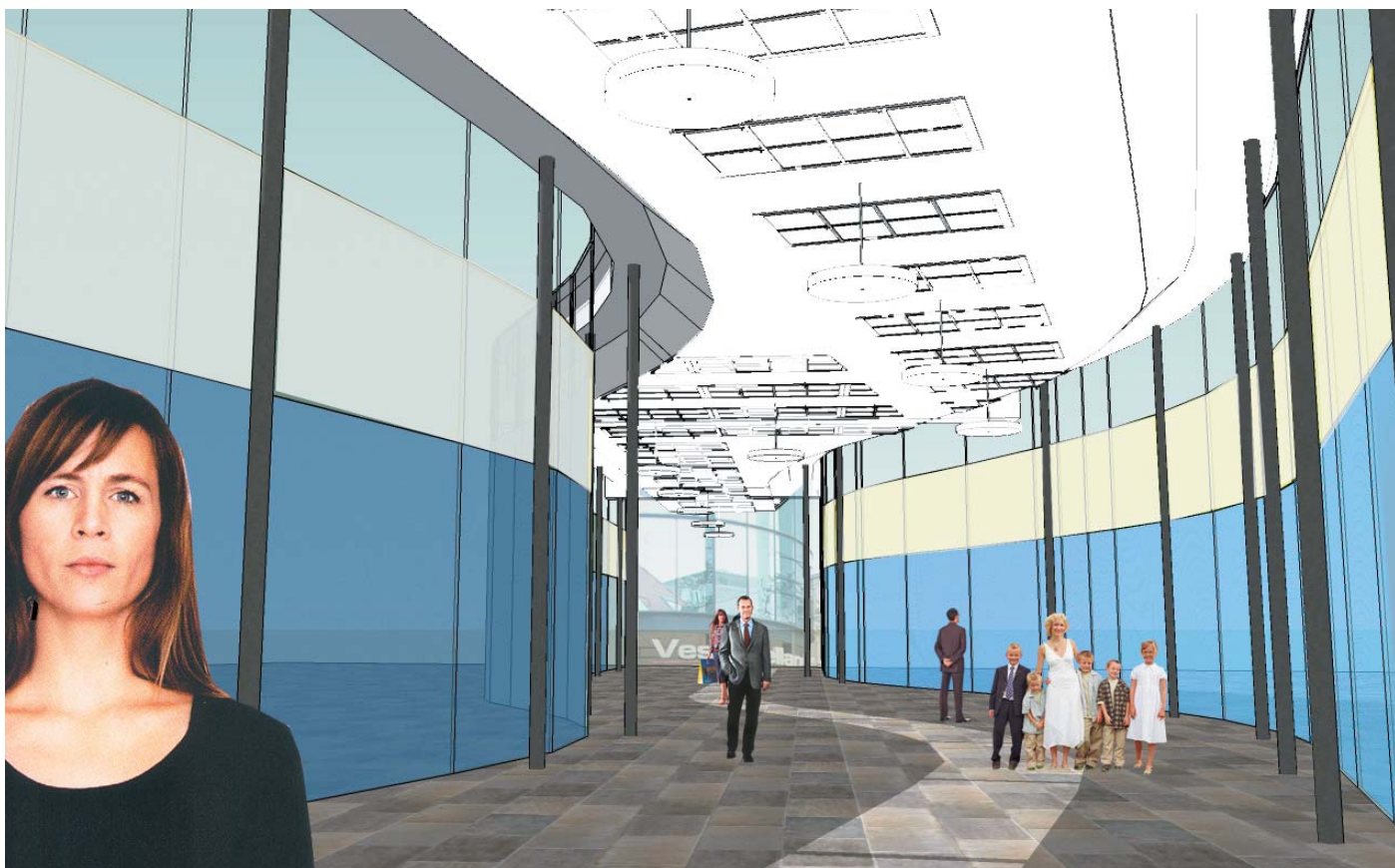
Cityarkaden, Slagelse 2007-