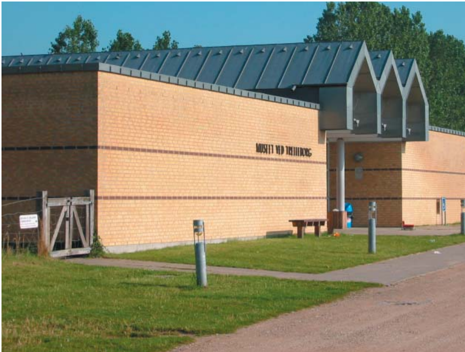
Trelleborg Vikinge museum 1994

En enkel og udtryksfuld museumsbygning som lægger sig flot i det bakkede landskab. Dets gule tegl og zinktag med sine takkede tage giver et roligt og afbalanceret udtryk. Bygningen spiller op til den gamle vikingehal bygget af National Museet og den frigravede ringborg. Vikingernes ånd synes at være i museet.