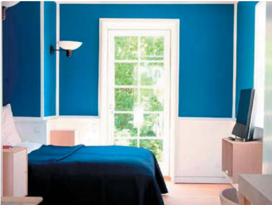
Dragsholm Slot 2007 4 mill. kr

Ombygning og renovering af ny værelsesfløj til Dragsholm Slot. Det er blevet til 5 nye værelser med hver sin indretning og hver sin farve. Inventar og vægge matcher hinanden og danner en hyggelig og intim atmosfære.