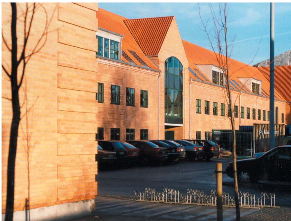
Perron 1, Slagelse 2003 40 mill. kr

Et stort kontor/butiks hus beliggende ved siden af den gamle togstation i Slagelse. Huset ligger faktisk opad perronen. Et hus med klare referencer til den gamle stationsbygning. Indpasser sig det eksisterende, men giver det en enkelthed og nutidighed.