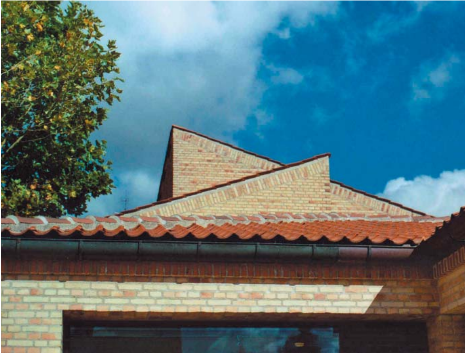
SEAS-NVE 2005 20 mill. kr

En stor "facelift" af hovedsædet for el-selskabet SEAS-NVE beliggende i Svinninge. Indgangspartiet er tilbygget. Huset er nu holdt i lyse farver med panelvægge i lys asketræ, som hjælper på akustikken.