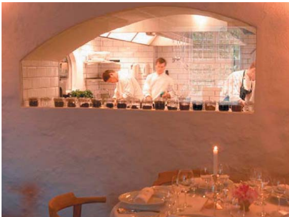
Dragsholm Slot 2005 3 mill. kr

Ombygning og renovering restauranten beliggende i den gamle kælder under slottet. De gamle hvælve og belægninger er bevaret og man fornemmer den tydelige borgstemning når man træder ind. En nænsom og enkel renovering af spisestedet.